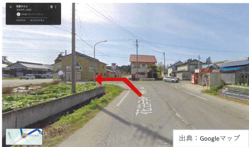
写真① 県道29号で左折