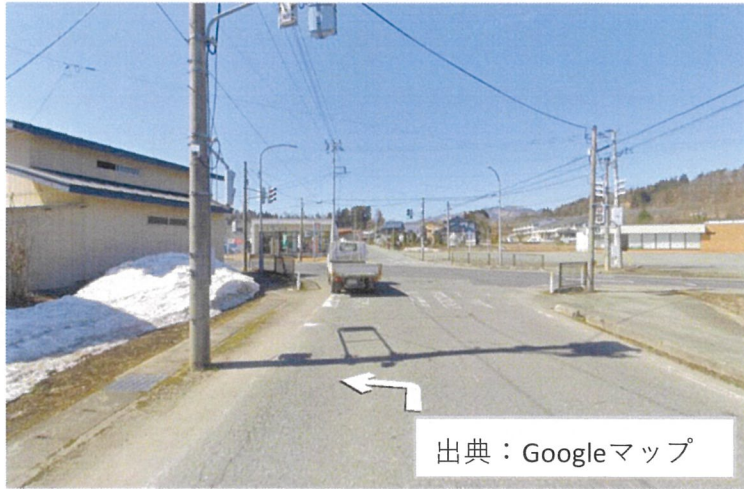
写真① 左折して、347号に入る